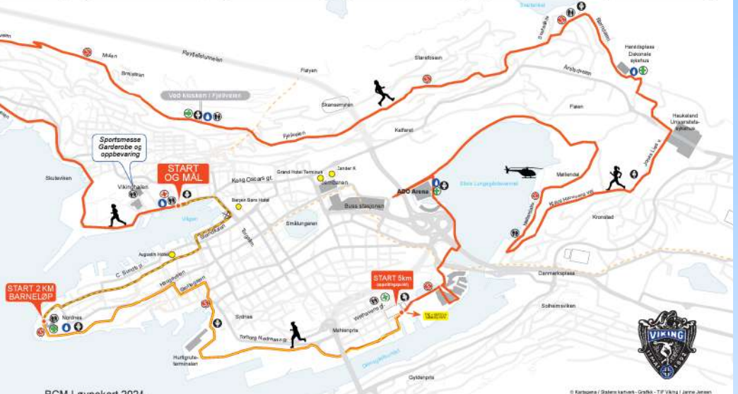
BCM Løypekart 2024.